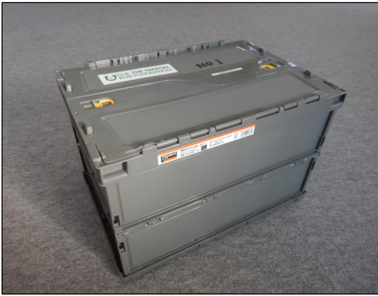
折り畳みコンテナ ×4